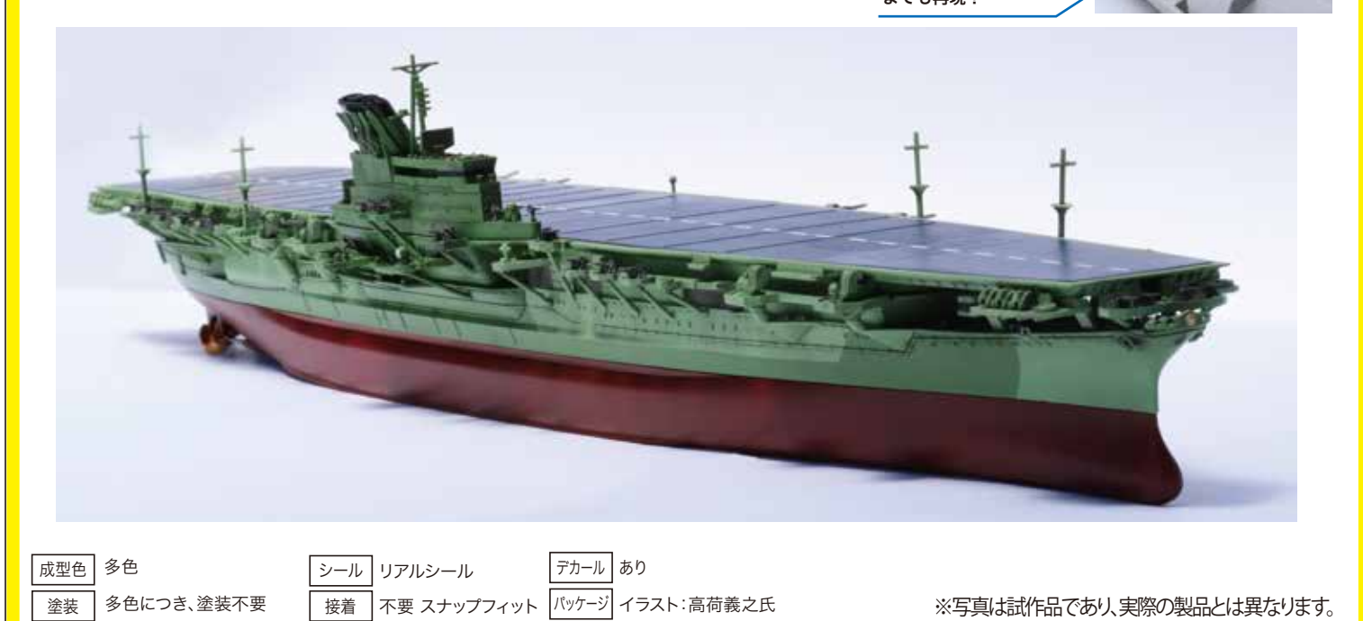
成型色 多色 シール リアルシール デカール あり 塗装 多色につき、塗装不要 接着 不要 スナップフィット パッケージ イラスト：高荷義之氏 ※写真は試作品であり実際の製品とは異なります。

日本海軍航空母艦 信濃 1/700艦NEXTシリーズ No.8 発売予定：16日 コードNo.460222 価格：4,600円 製品化にあたっては大和型戦艦の部品を共有せず全部を新設計・新金型を採用！ 信濃は大和型戦艦3番艦として建造中に空母へ計画変更され、昭和19年11月に竣工し、同月潜水艦の雷撃により沈没しました。 製品は、接着剤を必要としないスナップフィット式で設計されおり従来のキットとは一線を画す仕様としたシリーズ。 □主要な部品は色分け済みプラスチック部品で表現、一部の色調部は表面追従性に優れたリアルシールで再現。 □飛行甲板の色調は、当時の証言などを加味しながらやや青みがかった濃いグレーで再現。 □付属するシールには、両舷の対潜迷彩部分や、飛行甲板の白線を収録し塗装を行わなくても色彩表現ができるようになっています。 □塗装塗ユーザ向けに飛行甲板の白線デカールが合わせて付属。 □船体は左右分割式とし、艦首バルムス周辺の配置を正しい検証で再現した新設計の部品。 □飛行甲板は2ピース構成で、コンクリート敷きの甲板部と外縁部で分割、塗装表現を行う際にも便利な形としました。 □艦底パーツは大和と異なるバルジ形状を再現し、本製品の取り付け選択により洋上模型/フルハルモデルで仕上げることが可能。 □艦尾は、近年の2番艦武蔵の潜水調査で1番艦大和とは異なる、大高などが装備した角型のものであったと思われる、3番艦信濃には従来からの大和と同じ形状の艦と、大高などが装備した角型のタイプの2種を収録し新設計形状にも対応。 □起閉式アンテナ支柱は可動式の構造としています。 □艦橋部はスライド金型の採用で、4面それぞれに情報量多い彫刻を施しています。 □煙突の形状や後部短艇甲板付近の構造などは近年の資料や検証に基づき立体化。 □艦載機は、当時搭載されていたといわれる「桜花」、試験着艦を行った「紫電改」、搭載計画されていた「流星改」「彩雲」がそれぞれ新金型で付属します。 □ポナースパーツとして「水平双眼鏡」「機銃用弾薬箱」が収録されています。