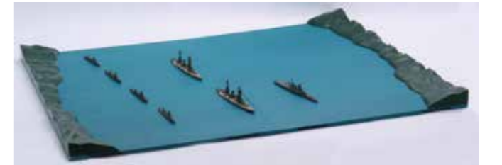
《海面パネルの組み立て》