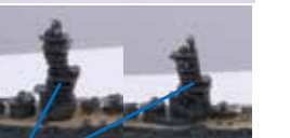
山城と扶桑の特有的な艦橋の形状差も専用部品で再現。